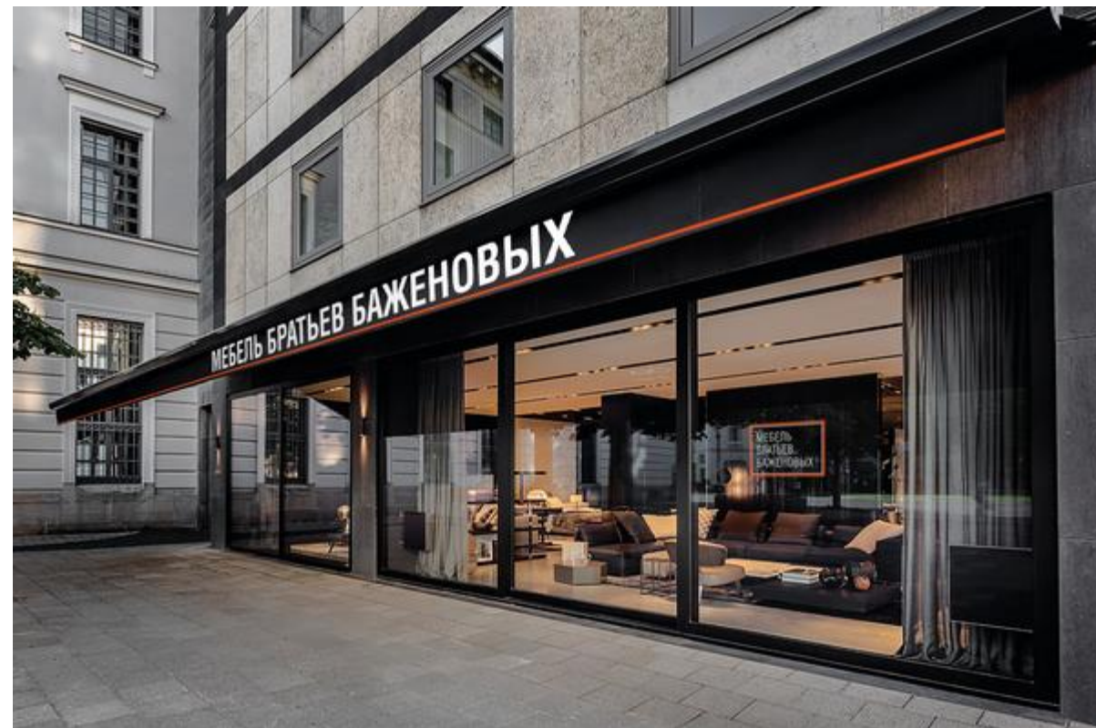
Отдельно стоящий салон