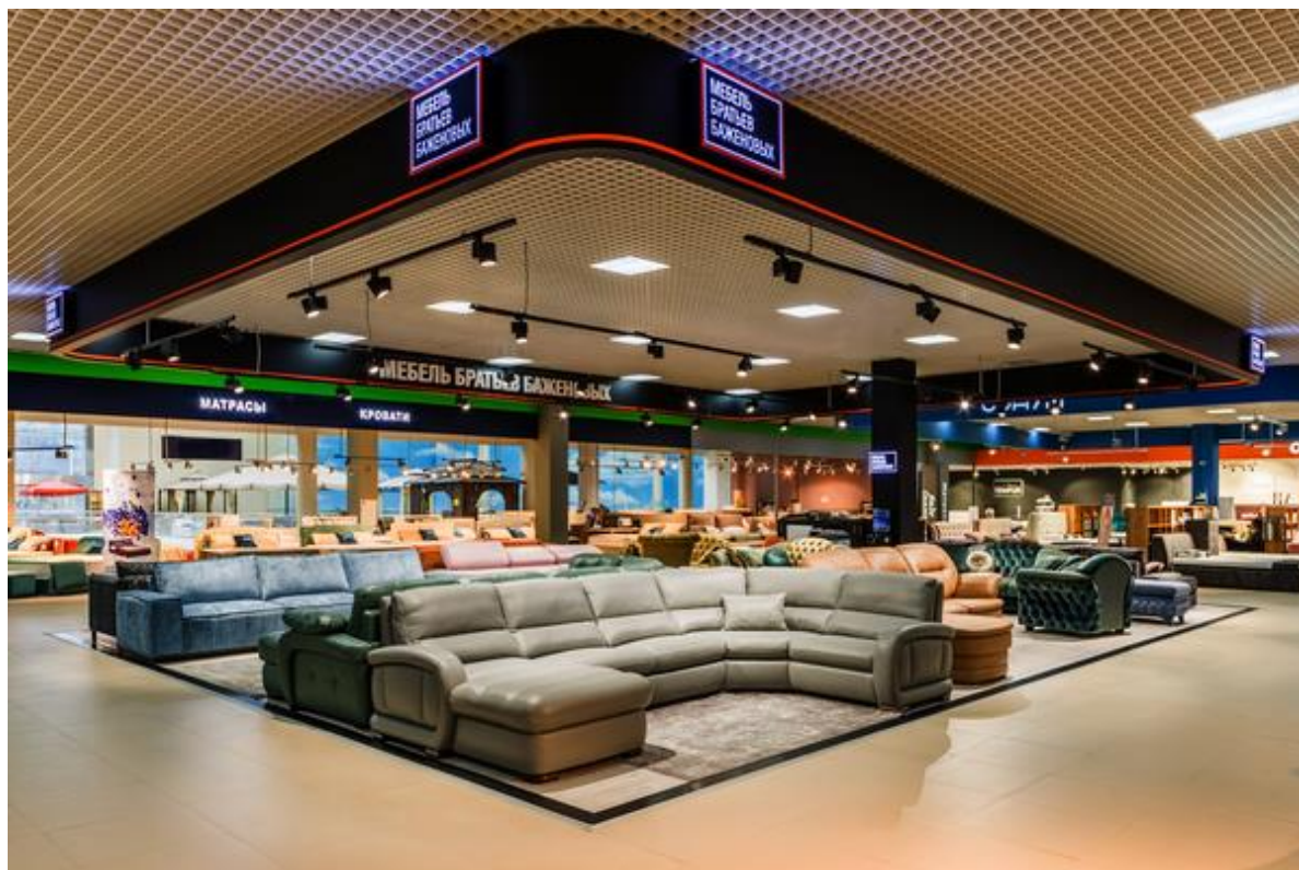
Салон в торговом центре